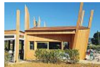
Colle Val d'Elsa Beccastelle, Località Belvedere, 85

poco si può fare di fronte al proliferare di edifici bizzarri e non in dialogo tra loro, tanto nei piccoli centri come nelle periferie delle città più grandi. Là dove però il luogo è già compromesso - siamo all'uscita di Colle Sud, dove la Valdelsa non si mostra di mura e antiche torri, ma di capannoni -, la comparsa